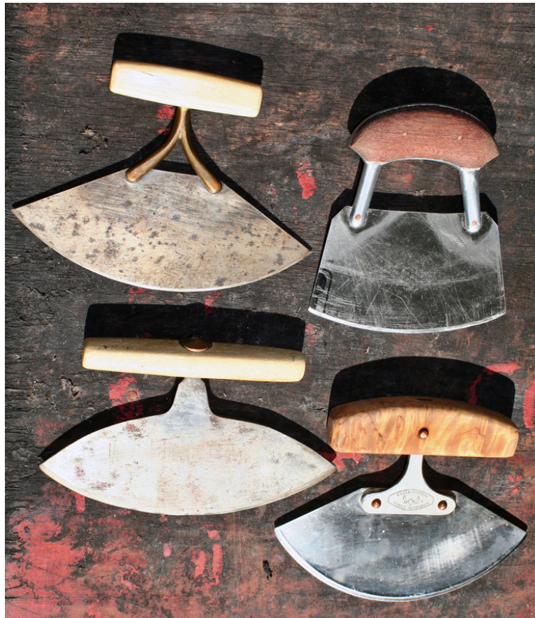
De forskellige ulo'er. (Foto: Ole G. Jensen).

Ulo'en, den halvmåneformede kniv, er et eksempel på et redskab hvis funktion har dikteret formen og som derfor er "opfundet", flere af hinanden uafhængige steder, i verden. Den kendes fra hele det eskimoiske område, og der er heller ikke megen forskel på skindskrabere af flint fra skandinavisk stenalder og på de første ulo'er eller forgængere herfor i Grønland. Et tilhugget stenstykke uden håndtag, formentlig har man dog brugt en skindlap til at holde på stenen og beskytte fingrene.