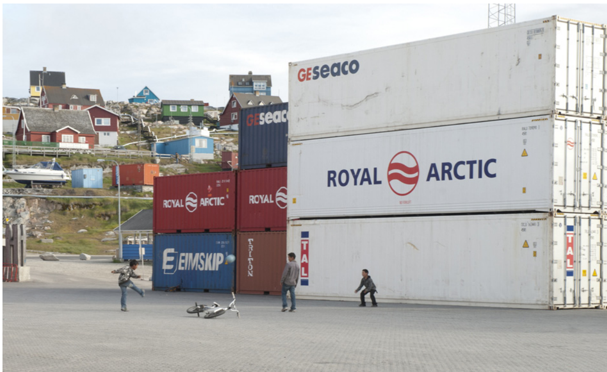
Børn der spiller fodbold på havnen i Asiaat.

Hvis det ikke er muligt at afholde et forældremøde, kan man sende et link via intra til forældrene og skrive lidt om, hvorfor man har valgt at arbejde med netop dette materiale og en dilemmaorienteret undervisningsform. Man er velkommen til at "klippe og stjæle" fra denne vejledning til dette formål.